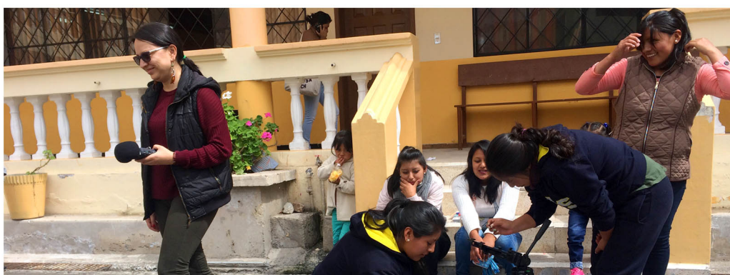
Centro de Apoyo, Otavalo