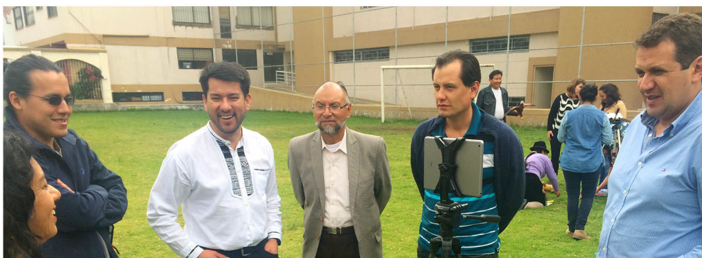
Universidad Politecnica Salesiana, Quito